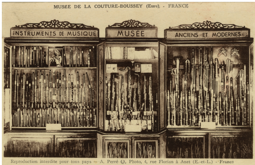
Carte postale tirée de l'épreuve ci-dessus, juillet 1938. Inv. 2021.0.1.23

aient réfléchi à des démarches pour mettre en sécurité une partie de la collection ; nous n'avons pas d'informations concernant la mise à l'abri ni le retour des objets dans les années suivantes, mais l'absence quasi totale de sources ne nous permet pas d'avoir de certitudes.