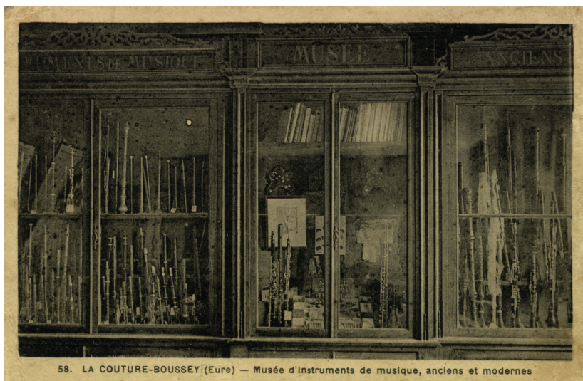
58. LA COUTURE-BOUSSEY (Eure) — Musée d'Instruments de musique, anciens et modernes

En août 1939, une nouvelle photographie de la vitrine est prise. La date de la prise du cliché et la lecture de l'image pourraient faire penser à la volonté de documenter l'état du musée et de ses collections, quelques jours avant la déclaration de guerre à l'Allemagne (3 septembre) : la gravure de Jean Hotteterre n'est plus visible, ainsi que le sarrusophone (inv. 1143) et deux cartels « Musée », le troisième est placé pour la première fois derrière des accessoires, apparemment pour ne pas les cacher. Dans le corps de droite, le fil électrique auquel était attachée la douille porte-lampe en céramique (visible dans les autres deux corps et manquante ici) pend sans son ampoule. Les instruments ne semblent pas être bien rangés