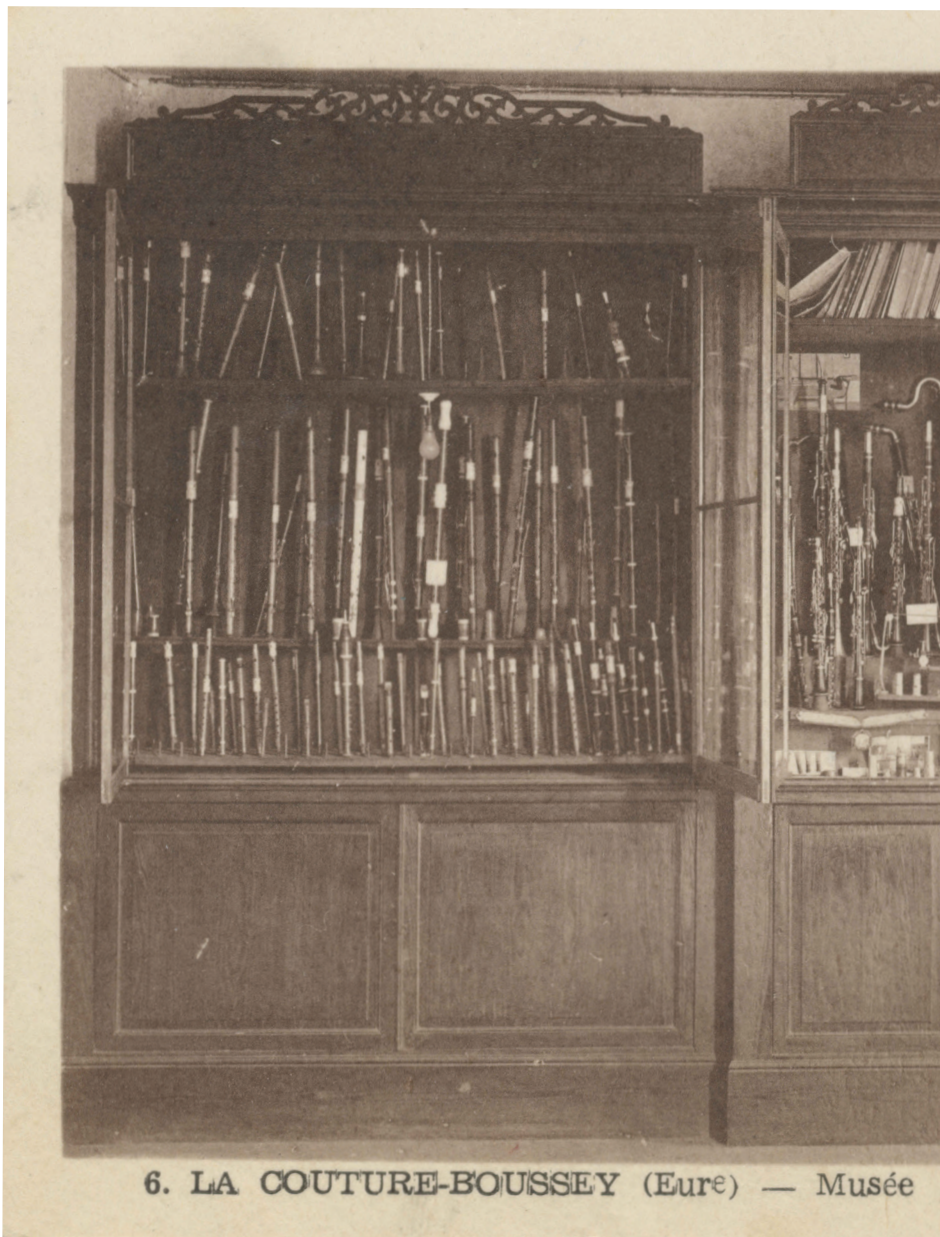
6. LA COUTURE-BOUISSEY (Eure) — Musée

La vitrine au mois d'août 1939, quelques jours avant la déclaration de guerre à l'Allemagne. Inv. 2022.9.4