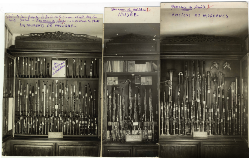
Épreuve pour la carte postale de février 1938. Inv. 2021.0.1.20

verticalement par rapport à l'année précédente et dans les corps de gauche et de droite, on remarque l'absence de quelques instruments.