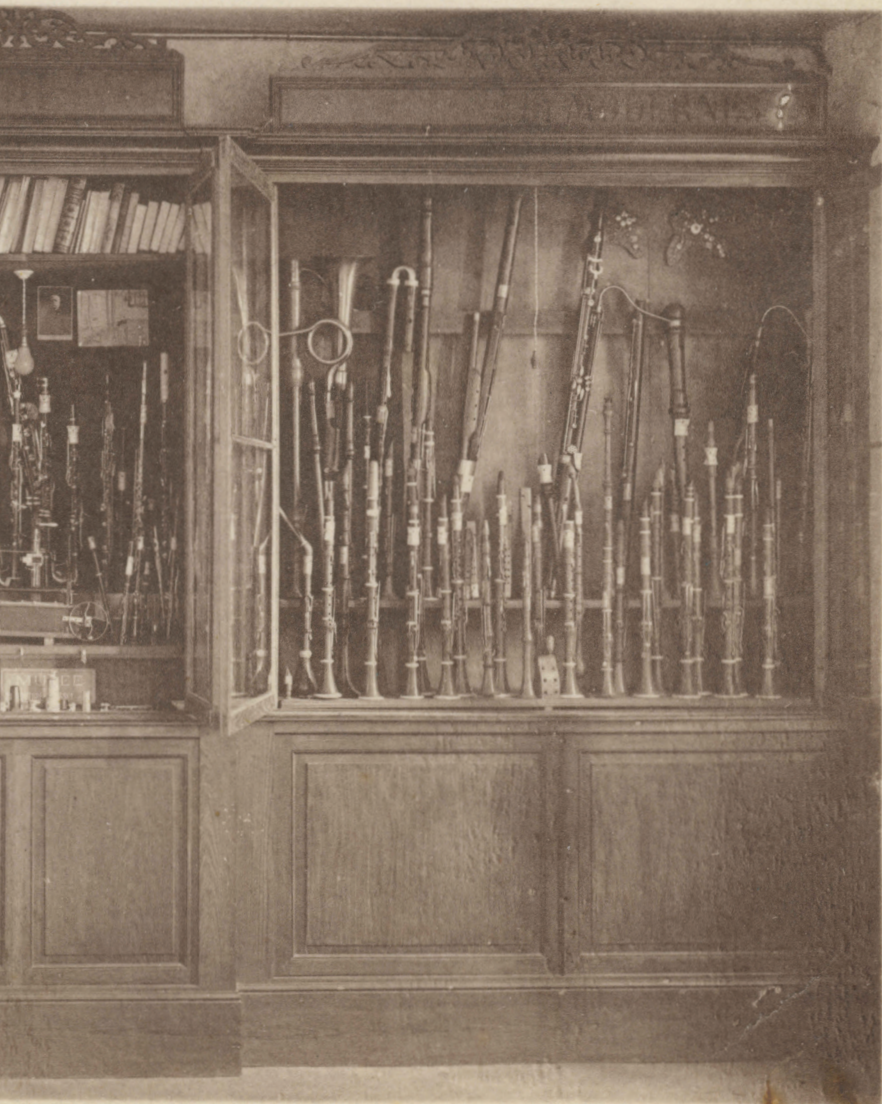
d'instruments de musique, anciens et modernes