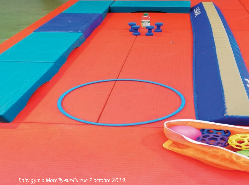
Baby gym à Marcilly-sur-Eure le 7 octobre 2019.