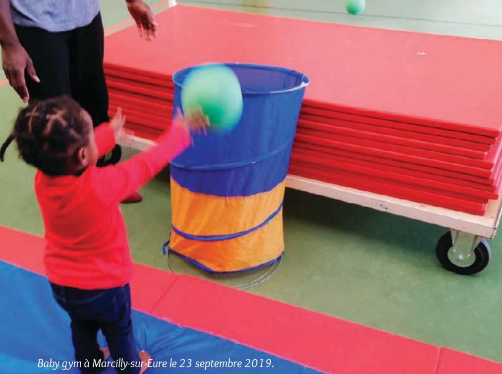
Baby gym à Marcilly-sur-Eure le 23 septembre 2019.