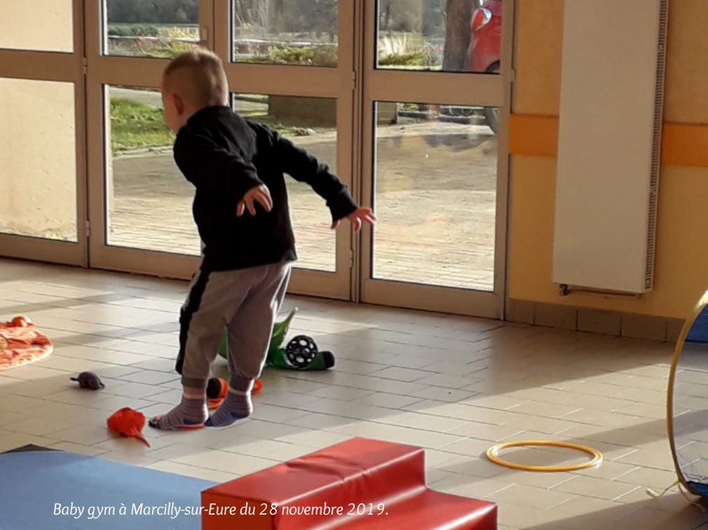
Baby gym à Marcilly-sur-Eure du 28 novembre 2019.