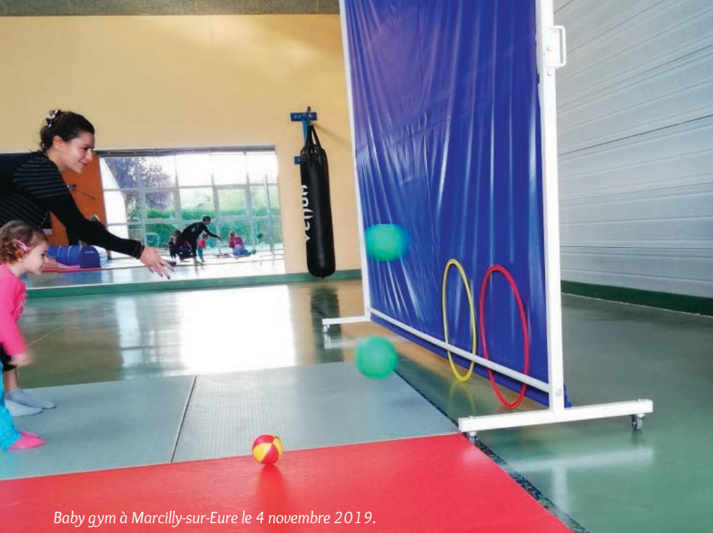
Baby gym à Marcilly-sur-Eure le 4 novembre 2019.